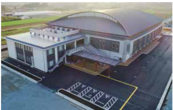
▲完成間近の総合体育館

子育て世代から高齢者まで集える多世代交流の場として多くの村民に利用していただければと願っております。そして仮設住宅にお住いの方々のご理解とご協力をいただき期待に応えるべき総仕上げを進めてまいります。