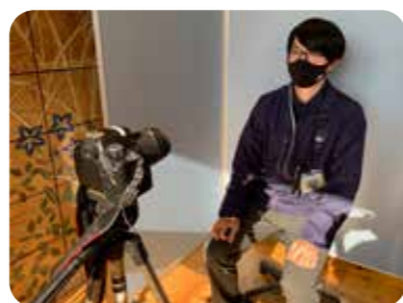
▲役場ロビーにて貼付用の写真を撮影できます

顔写真は役場で撮影し、無 料で印刷することができますよ うになりました。 窓口にて職員にお申し付け ください。