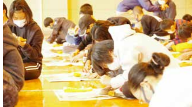
▲真剣に縄文笛を作成する児童たち

参加した児童たちは、縄文笛が焼きあがるまでの間に、令和4年の干支を石に描いたり、野焼きの火を利用した焼き芋や焼きマシュマロをおいしそうに食べていました。また、焼きあがった笛を互いに吹きあって音色を楽しみ、充実した一日を過ごしている様子でした。