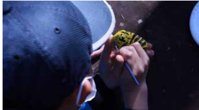
▲令和4年の干支「虎」を石に描く干支づくり体験