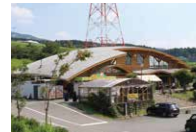
俵山交流館 萌の里