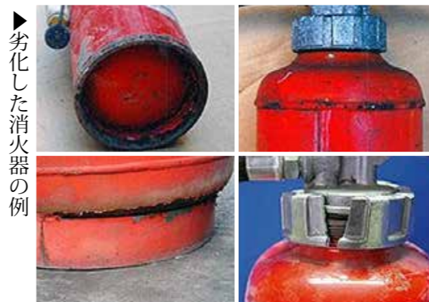
▶劣化した消火器の例

不用となった消火器を廃棄する場合は、リサイクルシール(有料)が必要となります。消火器は一般ごみとして出すことはできません。また消防署では消火器の回収は行っていません。