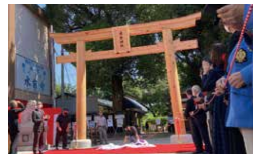
▲ナンゴウヒを使った鳥居（出水神社）

阿蘇南郷檜ブランド化推進協議会では、苗木代、枝払い、運搬費等を補助します。詳しくは下記までお問い合わせください。