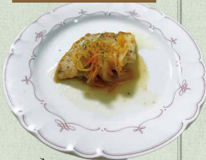
さっぱりレモンソースにパセリが香る