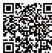
西原村ホームページ 給付金に関するページ