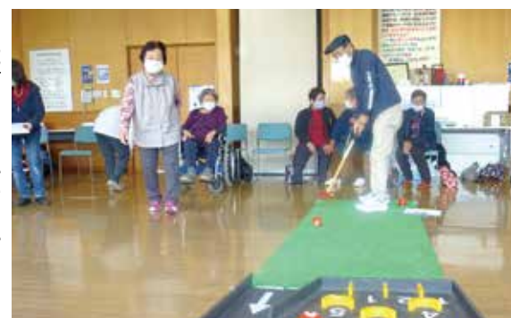
障がい児・者福祉活動費