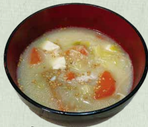
鶏、牛乳、お味噌の三位一体