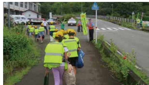
▼河原小学校前のキャンペーンの様子

交通安全協会西原支部は、女性の会、大津地域交通安全活動推進委員及び大津警察署と合同で、2学期の始業日にあわせて、河原小学校前及び秋田橋交差点において、児童の登校を見守るとともに、通行中の車両等に交通安全を訴える街頭キャンペーンに取り組みました。悲惨な交通事故に遭わない、そして起こさないよう交通ルールを守るとともに、安全運転を心がけましょう。