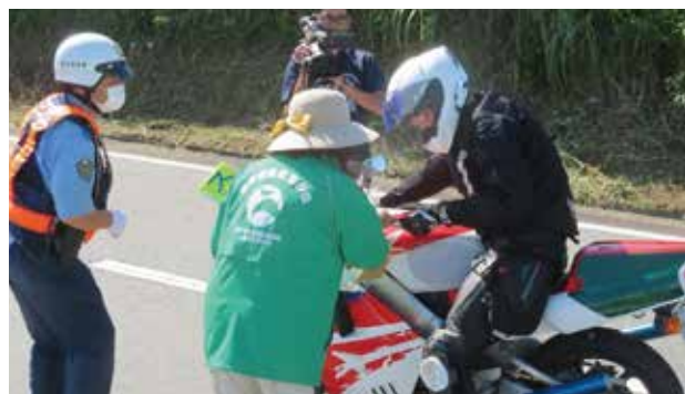
▼ライダーへ安全運転を呼び掛ける

交通安全協会西原支部、女性の会及び大津地域交通安全活動推進委員は、大津警察署及び高森警察署と合同で、8月27日、グリーンロード南阿蘇の展望所において、ライダーに事故防止を訴える街頭キャンペーンに取り組みました。