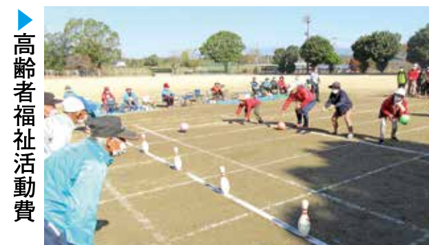
高齢者福祉活動費

皆様の善意で集められた募金は西原村社会福祉協議会が行っている地域福祉事業に大切に使われています。