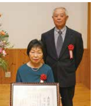
山西英雄・テル子 ご夫妻