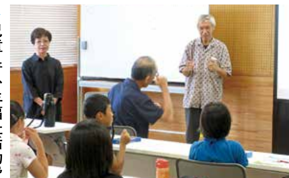
児童・青少年福祉活動費