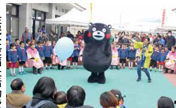
住民全般福祉活動費