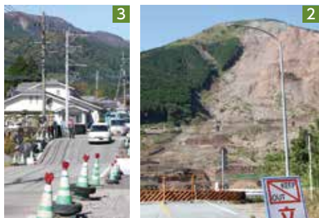
1_倒壊した拝殿(阿蘇神社) 2_崩落した阿蘇大橋と土砂崩れの跡(南阿蘇村) 3_地盤沈下で寸断された道路も現在は通行できる(阿蘇市)