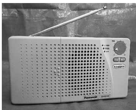
戸別受信機 (アナログ)