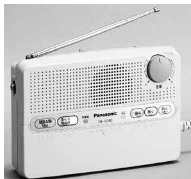
戸別受信機 (デジタル)