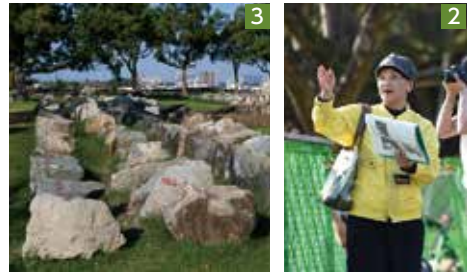
1_複数箇所です石垣が損壊(写真は戌亥櫓) 2_修復中の熊本城を案内するボランティアガイド 3_同じ位置に復元するため整理された崩れた石垣