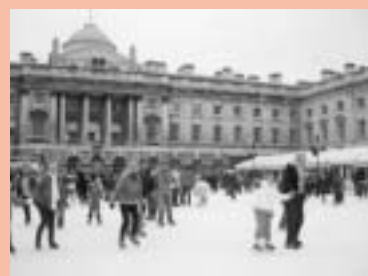
▲サマセットハウス(美術館)の中庭にできたスケートリンク

他にも、ロシアなど各国の旧正月を祝うイベントもあり、イギリス以外の国の文化に触れる機会も多く、さすがコスモポリタンな都市だな、と感心します。それではまた。