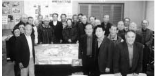
(12月定例会 募金集計の様子)