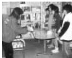
河原小学校 児童達がもち米を作り、フェスタにて売り上げた一部を共同募金へ