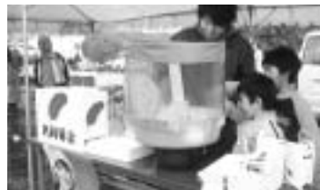
わた菓子による募金