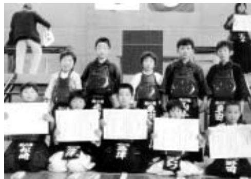
◀大津地区防犯剣道大会に出場した選手たち