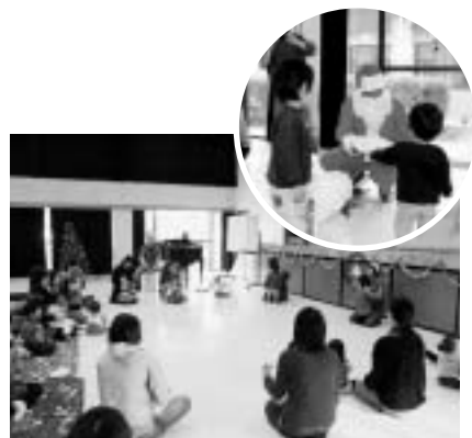
※にしはら保育園では一時保育を行っています。ご活用下さい。

また、待ちに待ったサンタさんの登場に喜んだり、びっくりして泣き出したりしてしまう場面もありましたが、プレゼントをもらって大喜びの子どもたちでした。楽しいクリスマス会になったことをうれしく思います。