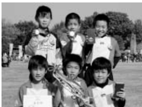
▶優勝を果たした3年生のメンバーたち

11月17日に行われた2007丸美屋お城納豆カップTKUジュニアサッカーフェスティバル大会で、学童サッカー「にしはらFCビアンカス」U-9（3年生）の1チームが、見事優勝カップを手にしました。