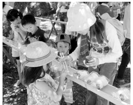
▲流しそうめんをいただきます