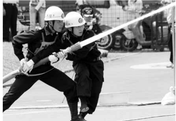
▲優勝した4分団2班の競技