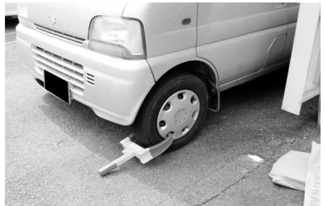
▲タイヤロック(処分の一環)