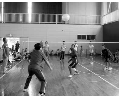
▲ボールを追いかけます

大人と子どももの垣根を越えて、みんな一体となってボールを追いかけ、夏の暑さに負けない熱い試合が繰り広げられました。さわやかな汗を流し、これまで以上に親子の親睦が深まったことでしょうか。参加された皆さん、お疲れ様でした。