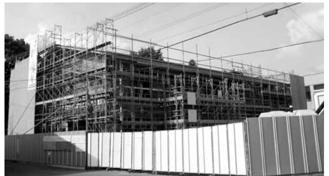
▲工事が進む生涯学習センター