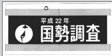
▲「国勢調査従事者用腕章」