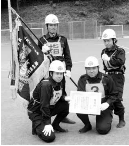
▲4分団2班のみなさん

なお、優勝隊は8月22日に荒尾市運動公園多目的広場で行われた第28回熊本県消防操法大会小型ポンプの部に阿蘇郡代表として出場しました。