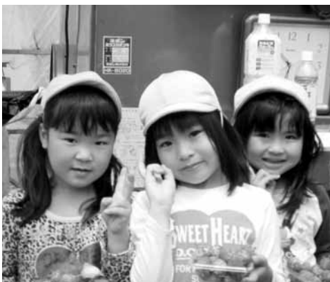
▲おいしそうなイチゴに大満足

保育園では、たくさんの方の地域の方々のご厚意、ご協力で園児達も楽しい体験がいつでもできています。快くご協力いただきありがとうございます。