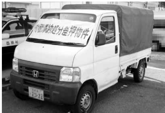
▲公売物件の軽商用車