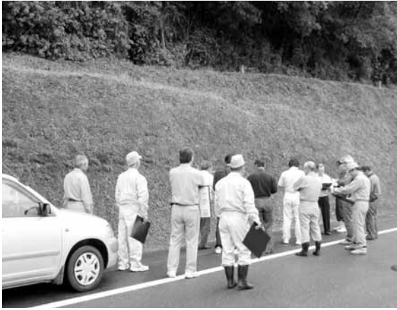
▲厳正な審査が行われます