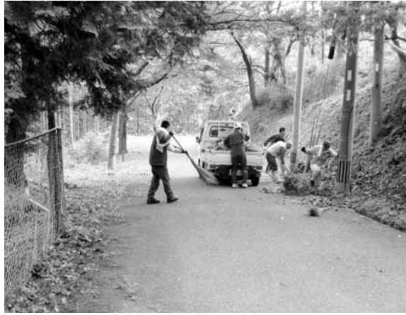
▲自衛隊によるボランティア清掃の様子