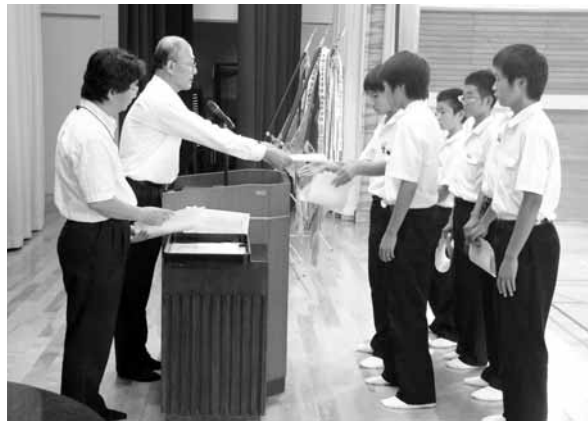
▲校内表彰式で賞状を受け取る生徒