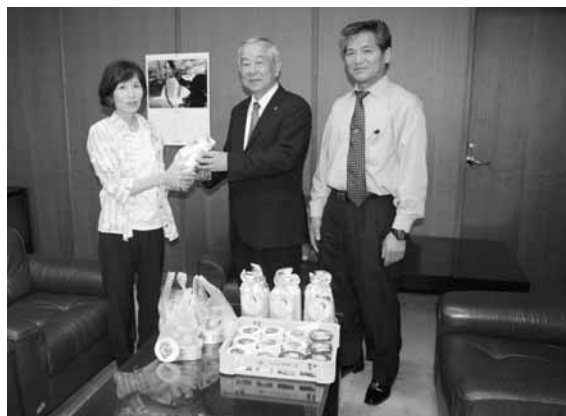
▲村長へ牛乳の手渡し