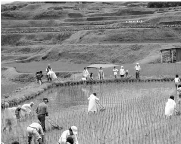
▲昔ながらの方法で水田除草

農作業は楽しいな！ 小野地区の棚田で水田除草 7月15日、小野地区の棚田にある「たんぼハウス」の水田にて、山西小学校4年生48人と小野地区中山間組合の方4名が参加し水田除草が行われました。今回、熊本県のまちづくり緑農事業の一環で県からもテレビ取材に來られ、大勢が見守る中、作業が行われました。水田では、子ども達が慣れない手押し式の除草機を使い、作業の傍らで見つけたアカハライモリなどの生き物に大興奮。緑豊かな小野地区の棚田の自然を満喫していました。