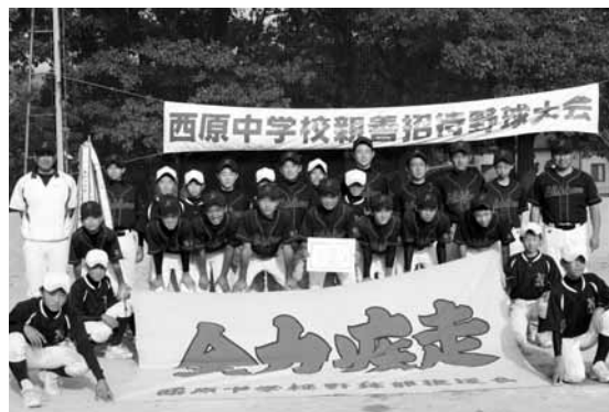
▲優勝した西原中野球部のみなさん