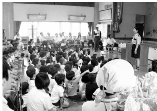
▲大津町で開催された キャラバンの様子

毎年、内閣府が全国各地に交通安全啓発キャラバンを派遣して「交通安全」を呼びかけています。全国を7コースに分け、各コースに広報車を配置し、都道府県をリレーして啓発活動が実施されます。