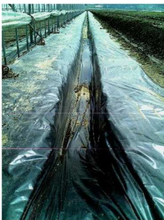
【ハウス周辺の排水路】 （マルチ展張で崩れ・雑草・浸水防止）