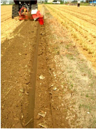
【水田露地は額縁明渠を設ける】

排水経路を点検し、畝溝や排水溝、明渠、暗渠等の排水機能を改善しておく。併せて、除草等も実施して、圃場周囲の環境改善を行っておく。また、圃場への雨水浸入に備えて、ポンプ等を準備し強制的に排水できるよう準備しておく。