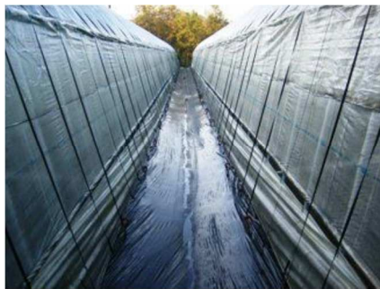
【ハウス内への滲入防止対策】