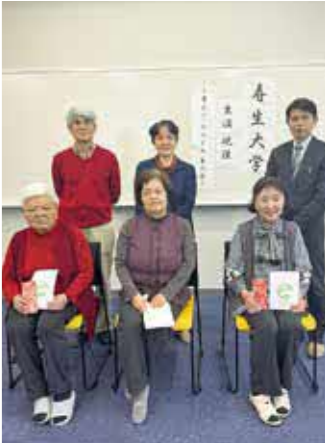
令和7年度 皆勤賞の表彰式も執り行いました