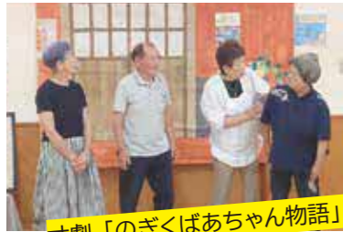
寸劇「のぎくばあちゃん物語」