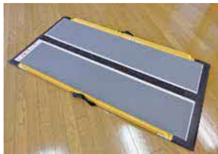
車椅子用スロープ