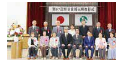
▲昨年の表彰式の様子