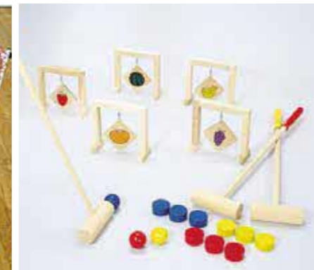
フルーツゲートボール