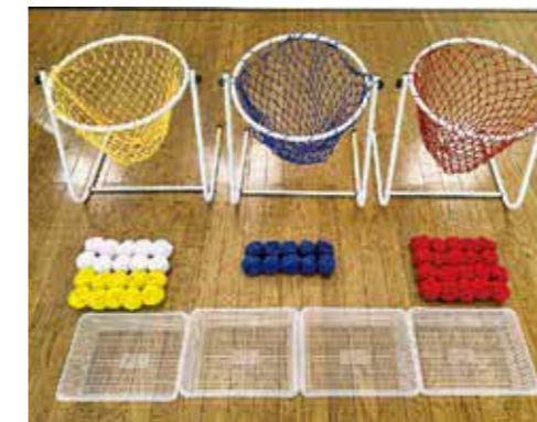
カラーフロアバスケット