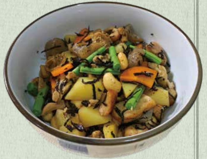
ゴロゴロ野菜と磯の香り