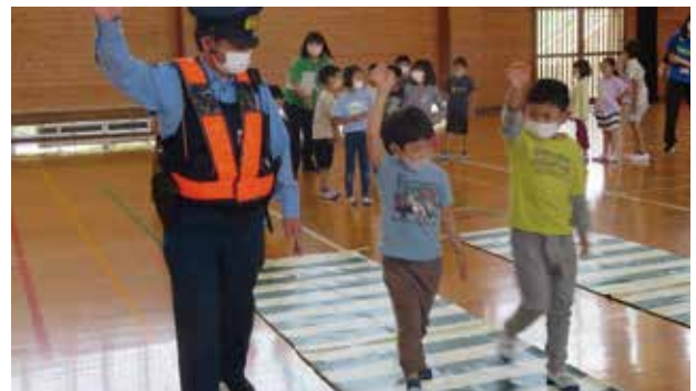
▼横断歩道を手を挙げて渡る子ども達