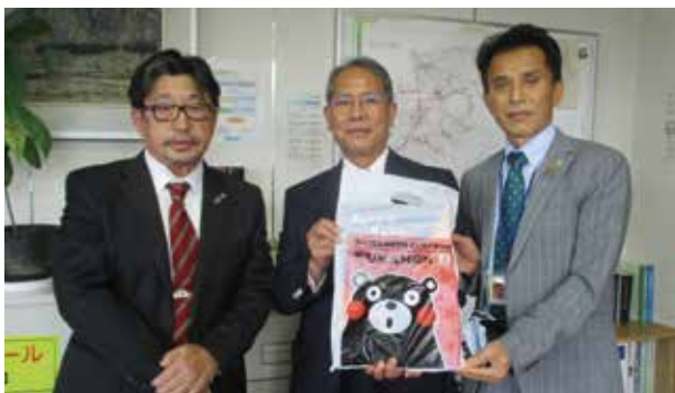
▼いただいた学用品は村内の小学校新入生へ

熊本県中古車自動車販売商工組合（JU熊本）から、新入学児童ハスケッチブックや色鉛筆等の学用品をいただきました。