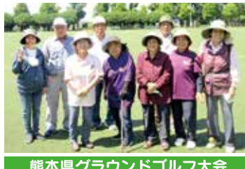
熊本県グラウンドゴルフ大会

【会員募集のお知らせ】是非、会員加入して交流を図り楽しみや生きがいづくりを見つけてみませんか!