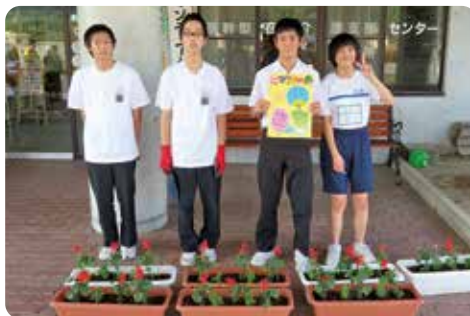
花の寄せ植え寄贈