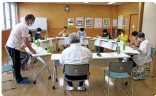
ボランティア協力校連絡会議

※ボランティア協力校関係者連絡会議の開催や、関係機関との連携を図りながら活動を推進しています。