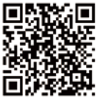
厚生労働省HP 「マスク着用について」