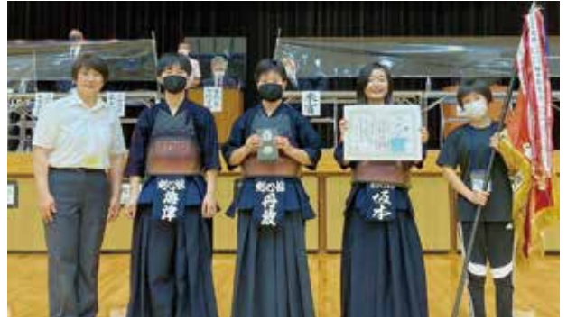
▼準優勝の小学生高学年のメンバー