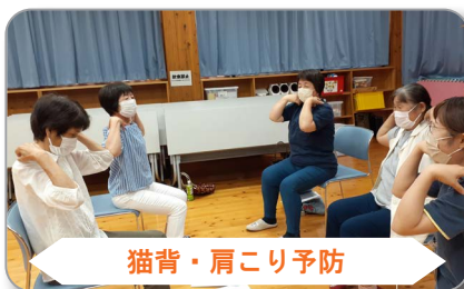
猫背・肩こり予防