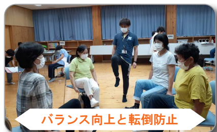
バランス向上と転倒防止