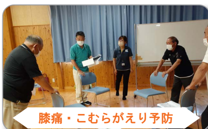
膝痛・こむらえり予防