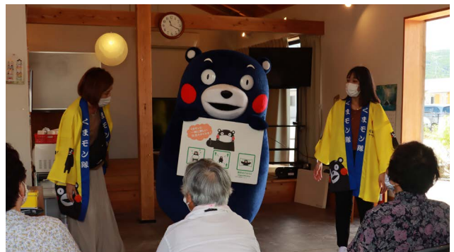
当日は手指消毒・検温・マスク着用等感染対策を徹底