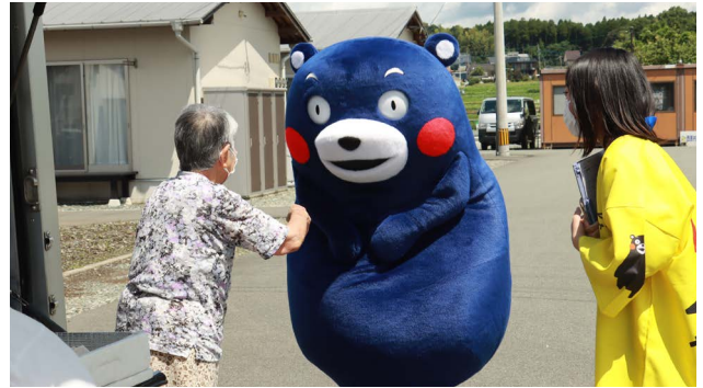
子どもからお年寄りまで大人気のくまモン

当日は手指消毒・マスク着用・検温など新型コロナウイルス感染対策が徹底され、最後にはくまモンからも一人一人の感染症予防の徹底についてのお願ひもありました。