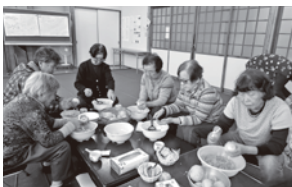
社会貢献(たんぼぼハウス作業)

スーパーサロンが始まって5ヶ月。地域の方々とふれあい、自分を生かしながら楽しい仲間づくりを進めています。「全員が主役」をモットーに「次回が楽しみ」と思えるようなプログラム作りを心掛け「会話に花」を咲かせています。