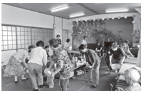
秋祭り出場(踊りの練習)