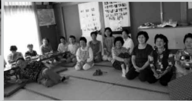
星田サロン (ばってん夢舞台)

★茶話会 昔話から現在まで..いつもの茶話会は話題の宝庫! 最近の出来ごとに“へえ~”とうなづいたり、携 帯電話で世の中が便利になった事を取り上げたり集 まりの中には話題が豊富にありました。