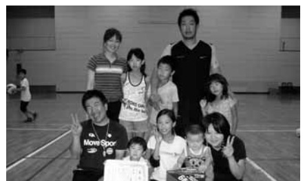
中村家チーム 上/マリーンチーム 下