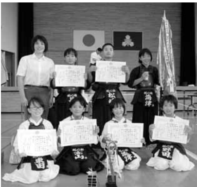
▲剣心館のメンバー