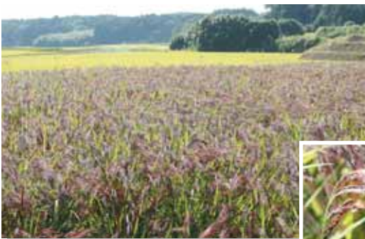
▲田んぼに広がる古代米