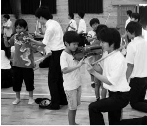
▲バイオリン上手に弾けたかな？

また、休憩時間に楽器体験があり、バイオリンやトランペットなど、初めてふれる子ども達は楽しそうに奏でていました。最後は河原小学校校歌が演奏され、子ども達の大きな歌声が体育館に響き渡りました。