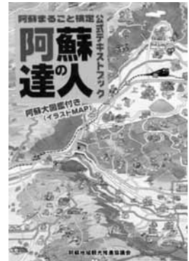
公式テキストブック「阿蘇の達人」

申込書設置場所： 阿蘇地域の市町村役場観光担当課・商工会・観光協会、阿蘇広域行政事務組合総務課、（財）阿蘇地域振興デザインセンター、各熊本県地域振興局総務振興課など