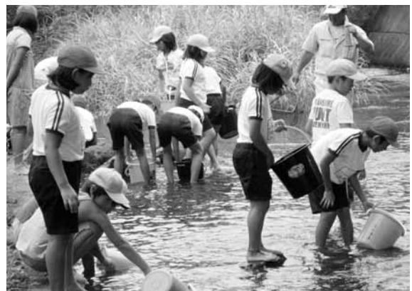
▲川に入り稚魚を放流