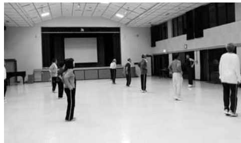
▲健康運動教室の様子