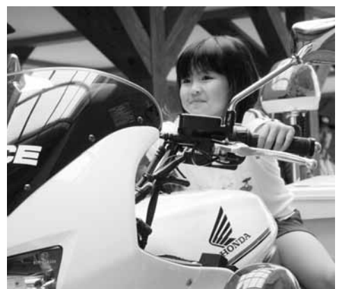
▲白バイに乗せてもらいました

保育園で行われた歓迎式では、園児による元気な交通安全宣言や、大津地区交通安全協会のみなさんによる交通安全教室などが開催され、園児たちは楽しく交通ルールを学びました。閉会后、園児たちはパトカーや白バイに乗せてもらい、大感激の様子でした。