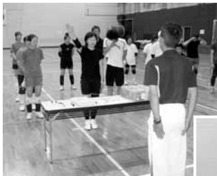
▲カブよく選手宣誓