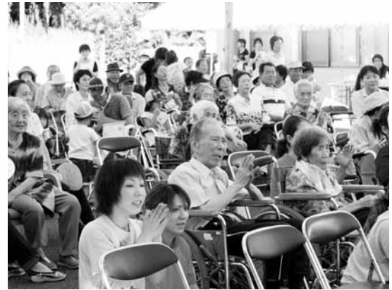
▲ステージを楽しむ観客のみなさん