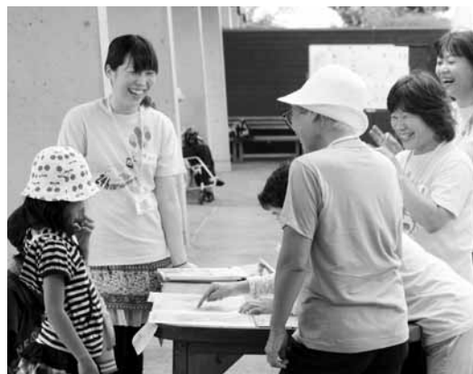
▲手話サークルによる手話教室