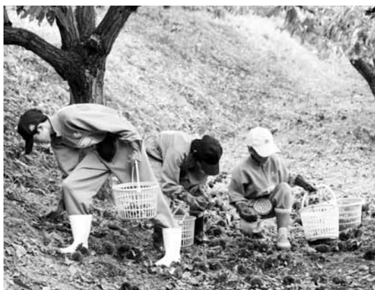
▲栗拾いを体験する生徒