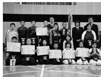
▲剣心館の選手たち