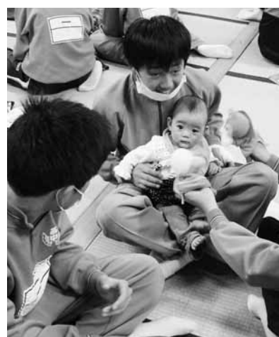
▲赤ちゃんを抱く生徒

商工会女性部・青年部、障害者自立支援センター「たんぼぼハウス」、はらっぱの家、萌の里などの温かい食べ物も用意されており、村内外から訪れた人々は心ゆくまで光の祭典を楽しんでいたようです。