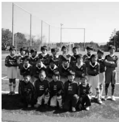
▲ジュニアの選手たち

この大会に出場した6年生は2人、ピアンカス1期生です。厳しい練習に耐え県大会出場までがんばってきました。今後は、ユース（中学）での活躍が期待されます。新人戦では、2月13日に阿蘇郡代表として県大会出場が決定しています。