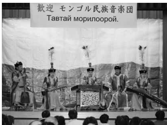
▲コンサートの様子

コンサート終了後には、音楽団の皆さんと記念撮影をする観客の姿も見受けられ、楽しいひとときが過ごせた様子でした。