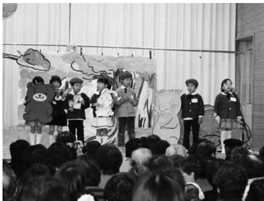
▲年長児による「サルくんとブタさん」

園児たちはそれぞれのプログラムに合わせた色とりどりの衣装に身を包み、力いっぱい歌や踊りを発表し、たくましく成長した姿を見せてくれました。