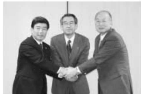
◀協定書調印式の様子