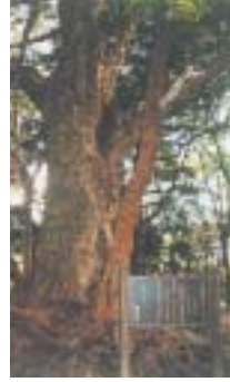
写真は、宮山地区の八王社境内にあるイチイガシの木です。現在、