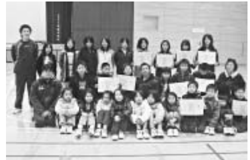
▲大会に出場したバドミントン部