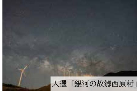
入選「銀河の故郷西原村」