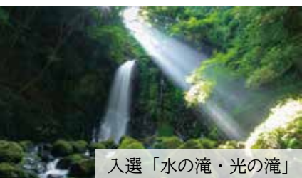
入選「水の滝・光の滝」