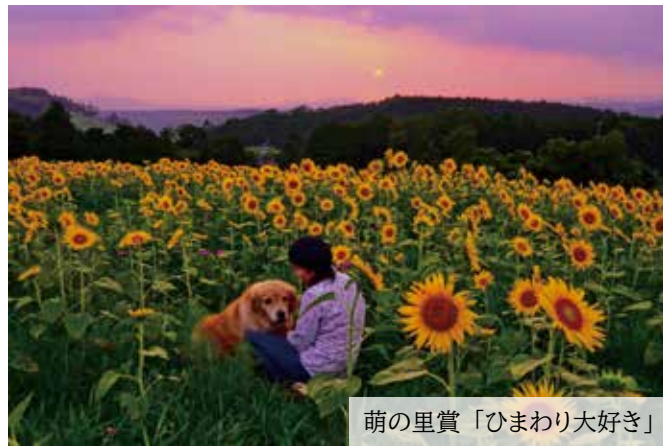
萌の里賞「ひまわり大好き」