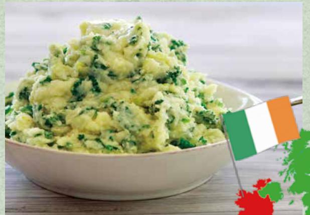
アイルランドの伝統料理