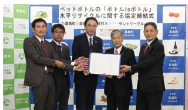
▼協定締結式の様子

西原村と嘉島町、益城町は11月24日、サントリーグループと回収したペットボトルを再度ペットボトルへ再生する「ボトルtoボトル」という水平リサイクル事業に共同で取り組む協定を結びました。