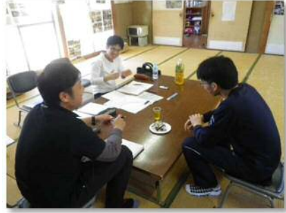
ヒアリングの様子