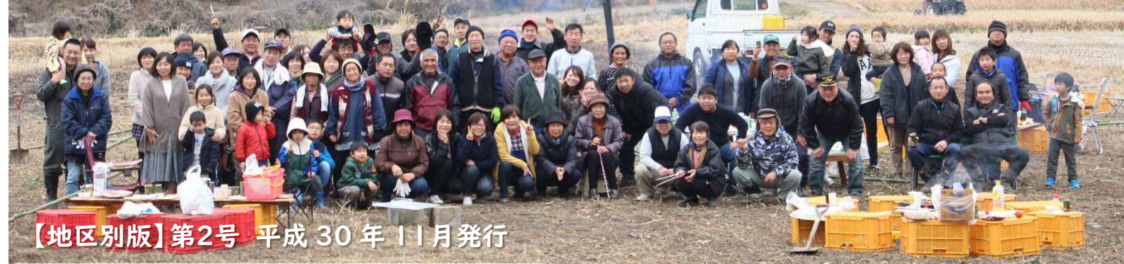
【地区別版】第2号 平成30年11月発行

秋も一段と深まり、陽だまりの恋しい季節となりました。インフルエンザも流行る時期ですので、手洗い・うがいでしっかり予防し、11月のイベントに元気にご参加ください。