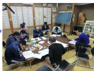
テレビの取材も 来ました！