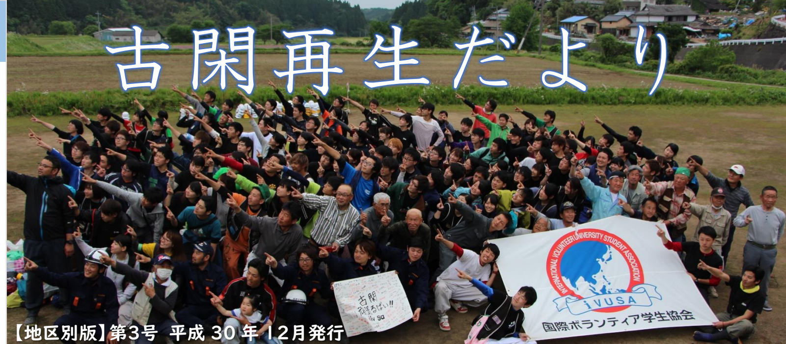
【地区別版】第3号 平成30年12月発行

今年も残すところあと1ヶ月になりました。なにかと忙しくなる時期ですが、1年の締めくくりですので悔いのないように過ごしたいですね！体調に気を付けて、よい年末年始を迎えましょう。