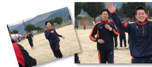
村民体育祭の様子

25日村民グラウンドで、スポーツフェスティバル(村民体育祭)がありました。参加された方も応援して下さった方も、ありがとうございました。