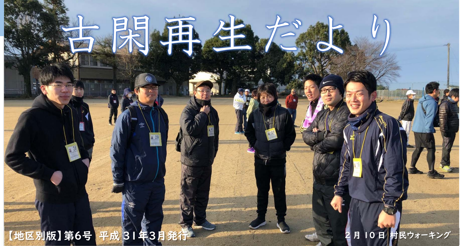
【地区別版】第6号 平成31年3月発行