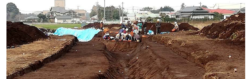
文化財の発掘調査が進む移転用宅地