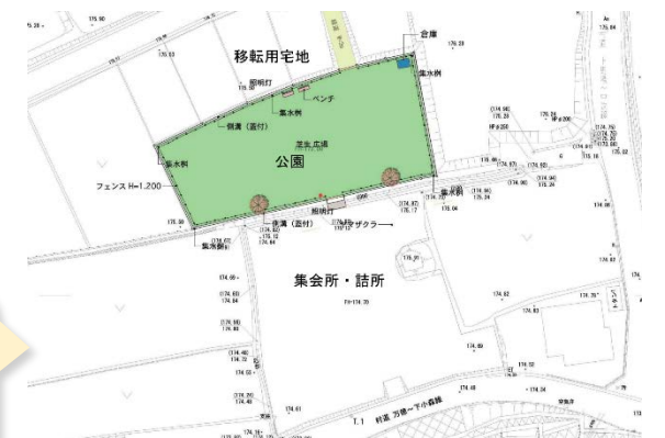
12月4日の会議で提示された公園の案

「今は集会所がないので、寄る場がない。みんなで語り合い、飲む機会が減った。」という声をよく聞きます。いよいよ集会所の設計が始まりますので、みんなの想いが詰まった集会所にしたいですね。