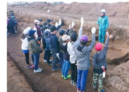
発掘体験会の様子