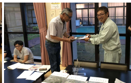
記録集とリーフレットをお渡しする様子