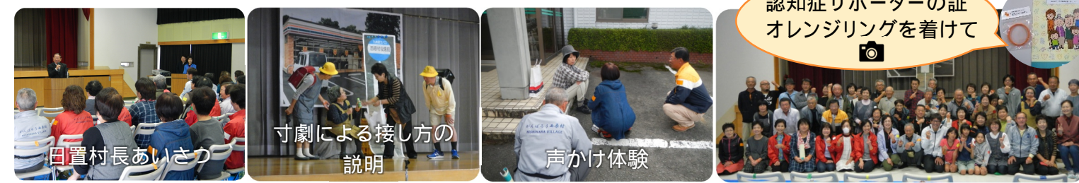
田置村長あいさつ

下小森地区が西原村で初の「認知症声かけ模擬体験」モデル地区となり、構造改善センターにて認知症サポーター養成講座が開催されました。寸劇を通して接し方ポイントがわかりやすく説明され、実際に外へ出て声かけ模擬体験が行われました。参加者の皆さんは、先ほど学んだ接し方のポイントを上手く抑え、認知症患者に扮した西原村社会福祉協議会の職員の方にやさしく声をかけてサポートをしていました。