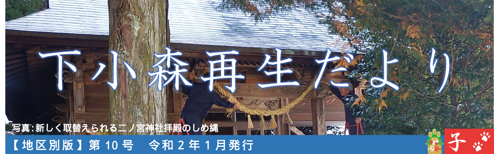
写真：新しく取替えられる二ノ宮神社拜殿のしめ縄

11月11日(月)の下小森地区別会議で、中央大学生との今後の交流について意見が交わされました。9月のバーベキュー交流会や公役に参加してもらったことで、「若い人達と話す機会ができて良い時間だった」「普段の公役では若い参加者がいないので、参加してもらったことで活気づいた。ありがたかった」などの声が挙がりました。震災をきっかけにボランティアとして西原村を来訪している彼らですが、復旧・復興が進む中、新たな活動を模索しています。下小森と繋がった縁を、途切れることなくお互いにとってより良い関係を築き、絆として繋がっていかれたらと考えています。