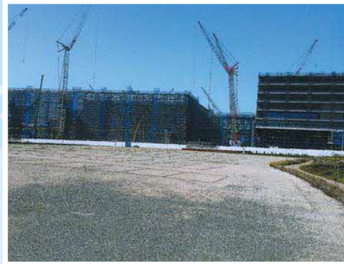
菊陽町に進出する建設中のTSMC半導体工場

発言が「～である。」調で記載していますが、質問・答弁は丁寧語で発言されています。