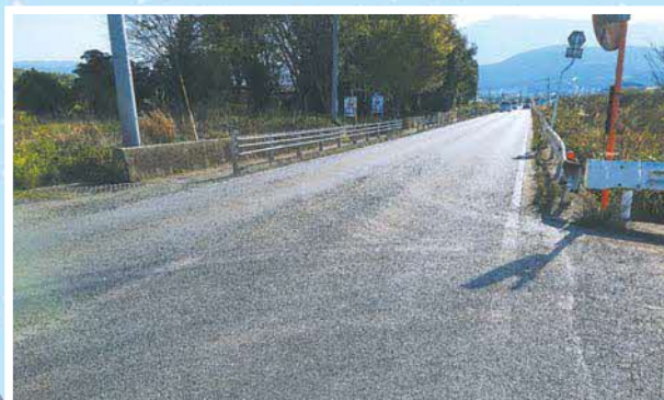
村道下新所下原3号線交差点まで拡幅計画済み

【村長】今の計画が完了するまで3～4年を要する。村道下新所下原3号線交差点から東方面への拡幅工事については県と連携を強化し積極的に要望していきたい。