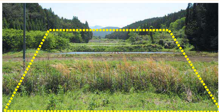
盛土で造成する工業団地予定地

【答】盛土に関しては、熱海市の事例もあり、不安要素はあると思うが、今回の盛土に関しては国土交通省から出ている宅地防災マニュアルにそって設計をしてい