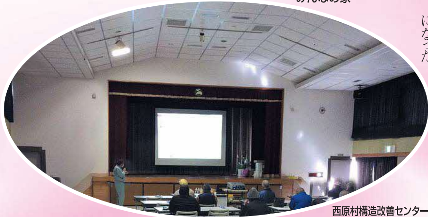
西原村構造改善センター 《天井部》

【産業課長】令和4年度当初、コロナウイルス感染症予防接種が夏ぐらいには終わる予定で計画し、接種完了後速やかに工事着工と考えていたが、結果的に、年度いっぱい予防接種が行われたので工事が出来ず、今回減額補正になった。