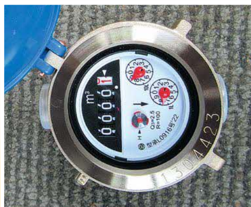
村内に設置の水道メーター

【答】一件当たり、1,200円である。現在契約件数は約1,800件程になっている。