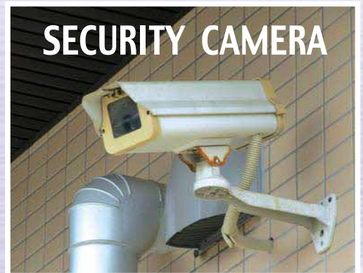
現在設置されている従来型の防犯カメラ

【村長】防犯カメラの設置については、住民のプライバシーを守りながら、重要な案件は、個室を使用するよう職員に指導して対応していく。