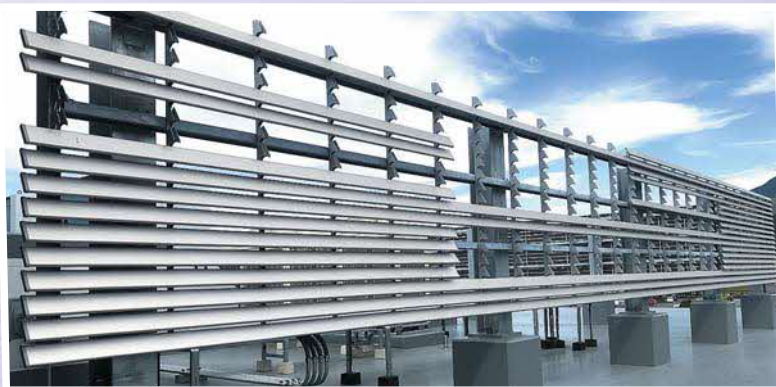
台風で破損した総合体育館ルーバー

【問】台風で破損した総合体育館の修理代として、128万7千円計上してあるが、破損したルーバー設置自体が間違っていたと思う。原型復旧の修理工事では、今後起こりうる災害でまた、壊れて最悪避難者等へ損害を与えるのではないか。 【教育課長】今回の総合体育館災害被害の復旧工事は、同等な修理工事でない保険が出ない。但し、避難所になったときに安全が確保できるということも念頭にいれて対応していく。