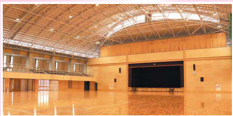
総合体育館アリーナ

【企画商工課長】コンビニでの住民票、印鑑証明書、住民票記載事項証明書、課税証明書、所得証明書等各種証明書の発行という事で、令和6年度からの導入を目指しており、システム等の開発委託料を計上させている。