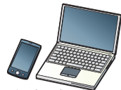
インターネット、気象庁ホームページ