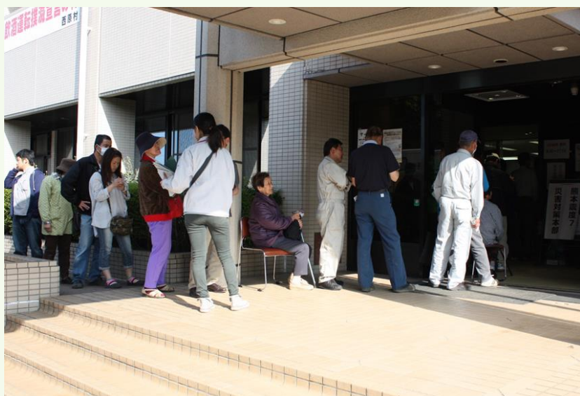
申請受付会場(役場)入口の様子