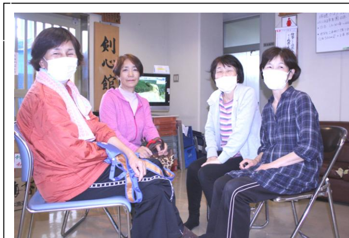
村民体育館で久しぶりの再会!!