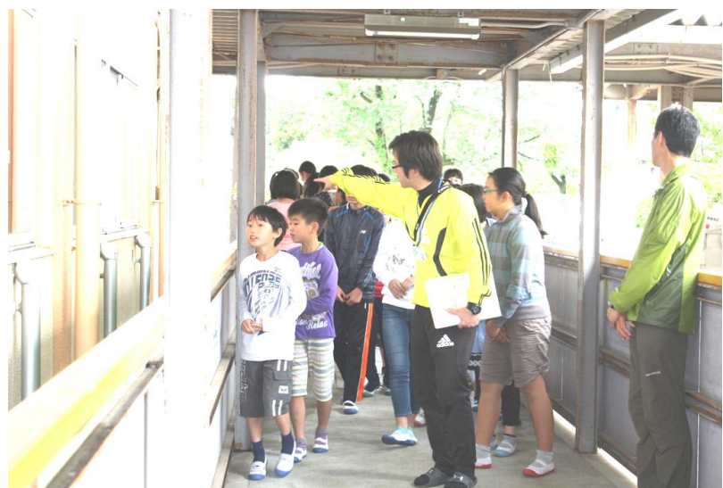
危険箇所の確認の様子