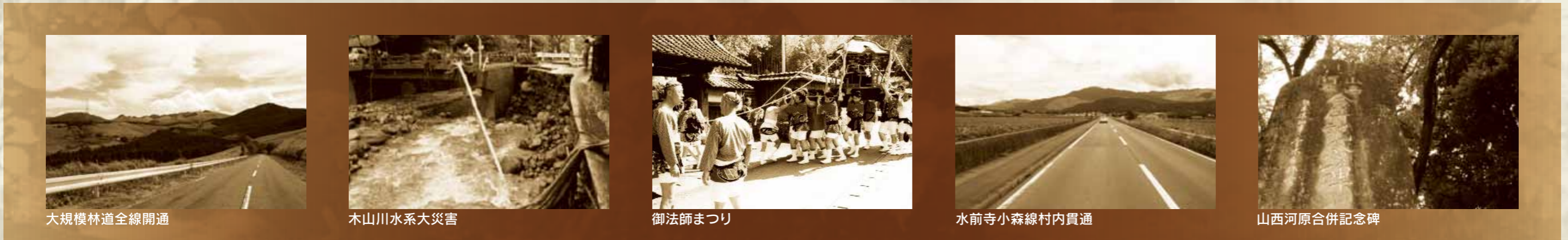
大規模林道全線開通