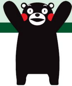
くまもとサプライズキャラクター くまモン

熊本県と県内市町村は、平成25年度までに個人住民税の特別徴収事業者への完全指定を実施します。