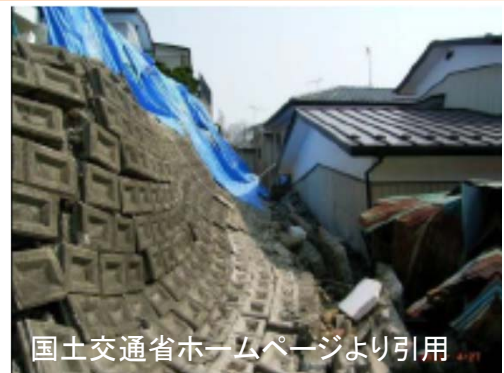
東日本大震災におけるがけ崩れ対策事業対象となった人口がけ地